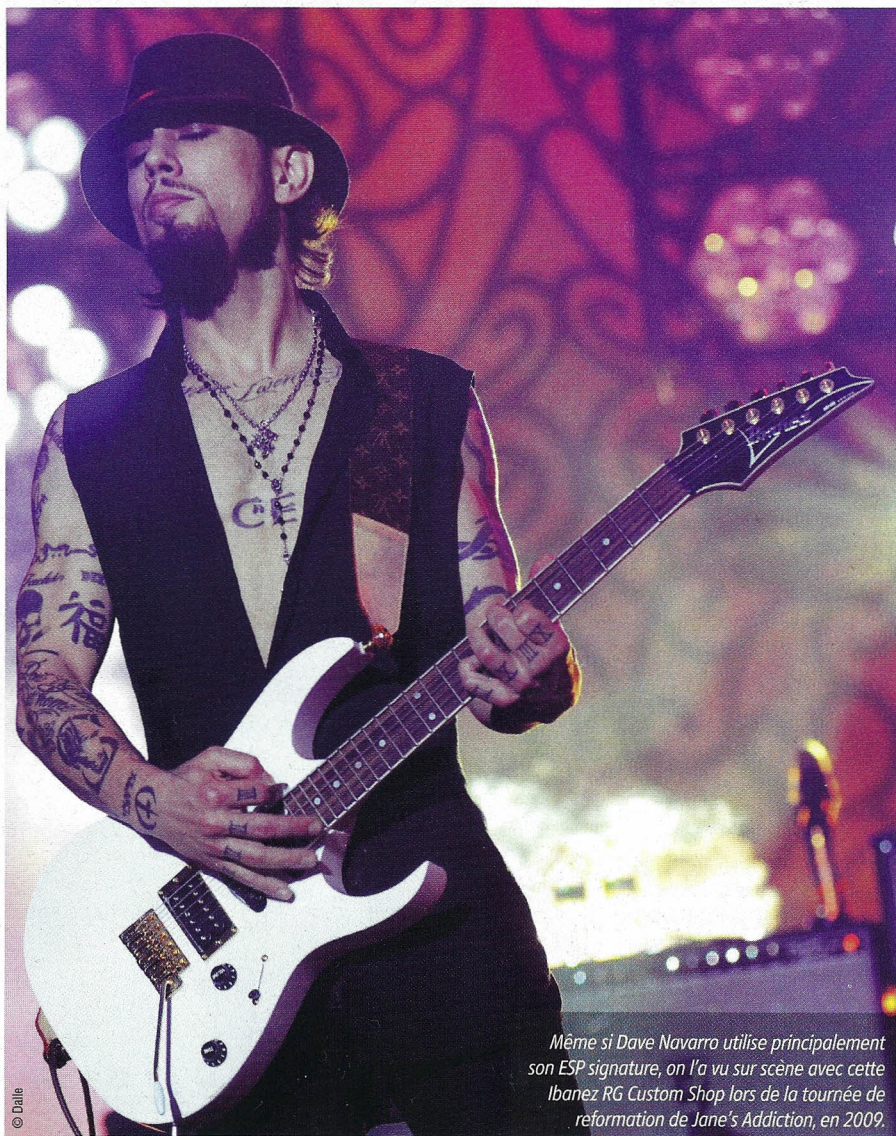
Même si Dave Navarro utilise principalement son ESP signature, on l'a vu sur scène avec cette Ibanez RG Custom Shop lors de la tournée de reformation de Jane's Addiction, en 2009.

Jane's Addiction en incrustation (l'utilisation de ce symbole remonte en fait au premier groupe de Perry Farrell, Psi Com, ndr) et un dessin très sombre sur le pickguard, censé à la fois me représenter et être un coup de chapeau aux bonnes vieilles Hummingbird.